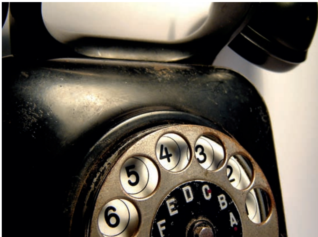
W sierpniu rozpoczęła się wymiana telefonów w ESBANKU