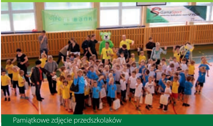
Pamiątkowe zdjęcie przedszkolaków

W październiku RAP wspólnie z naszym bankiem zorganizował turniej piłki nożnej przedszkolaków – „ESBANK z RAPEM z przedszkolakiem”. Wzięło w nim udział osiemdziesiąt dzieciaków z ośmiu radomszczańskich przedszkoli. Mali piłkarze z zapałem kopali piłkę i zdobywali kolejne gole. Zwycięzcą turnieju została Publiczne Przedszkole nr 10, ale nagrody trafiły do wszystkich grających dzieciaków – bo najważniejszy był sam udział. Młodym piłkarzom życzymy kolejnych sukcesów!