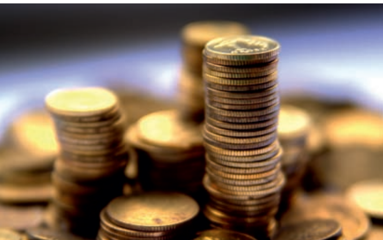
Polecenie zapłaty i zlecenie stałe to sposoby na zaoszczędzenie czasu i pieniędzy

Zlecenie stałe i polecenie zapłaty są wygodnym sposobem na regulowanie comiesięcznych zobowiązań. Dzięki nim można zaoszczędzić zarówno czas, jak i pieniądze.