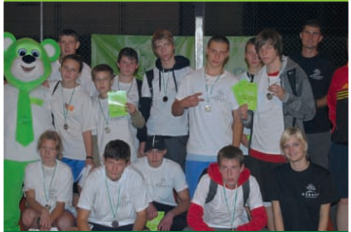
Zwycięcy ESBANK Streetballmanii

Wrzesień w Radomsku upłynął pod znakiem sportowych emocji. Dzięki wsparciu ESBANKU Banku Spółdzielczego w mieście zorganizowano Turniej Koszykówki 3-osobowej „ESBANK Streetballmania” oraz Turniej Tenisa o puchar Prezesa ESBANKU Banku Spółdzielczego.