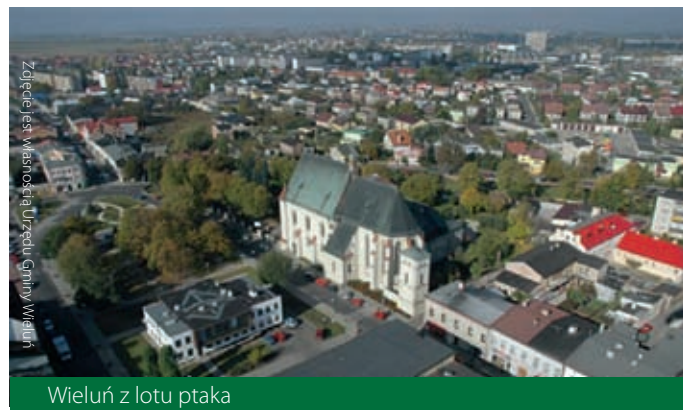
Wieluń z lotu ptaka

Wieluń jest jednym z 25 miast otoczonych za czasów Kazimierza Wielkiego murami obronnymi. Miały one długość 1300 m i obejmowały teren starego miasta o powierzchni 12 ha. Do czasów dzisiejszych zachowała się Brama Krakowska, która obecnie służy jako wieża ratuszowa. Pozostałości po murach można także podziwiać w innych częściach miasta. – Goście odwiedzający nasze miasto mówią, że staje się ono coraz piękniejsze, a szczególną uwagę zwracają nasze plandy, jedne z najpiękniejszych w Polsce. Potwierdzeniem tego jest fakt, że w ubiegłym roku od Towarzystwa Urbanistów Polskich nasze miasto otrzymało Grand Prix za realizację projektu