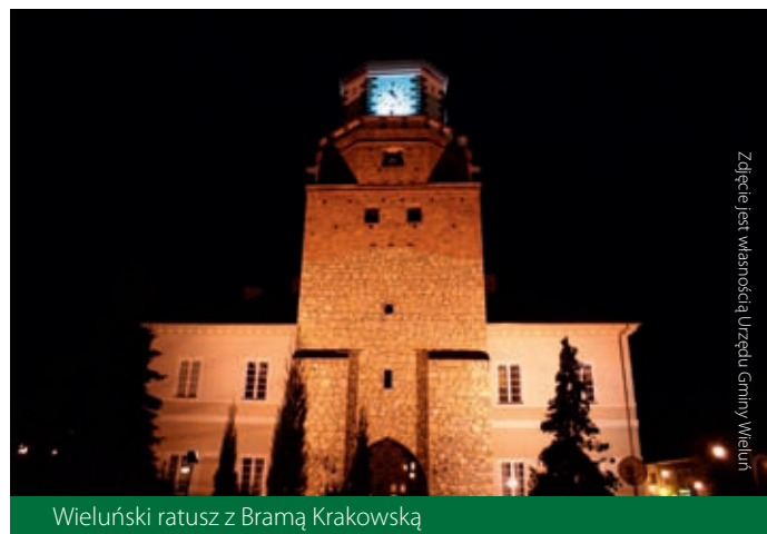
Wieluński ratusz z Bramą Krakowską