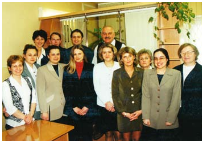
Pamiątkowe zdjęcie Pracowników Banku z roku 2001

Pierwsze kroki w sektorze bankowym stawiałam w Lgocie Wielkiej. Od tamtego czasu zmieniła się specyfika oraz charakter pracy. Powstało dużo nowych placówek, w związku z tym wzrosło również zatrudnienie. Dawniej byliśmy postrzegani jako typowo rolniczy bank. Dzisiaj