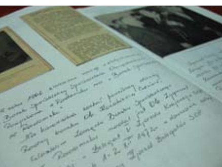
Zapiski z bankowej kroniki