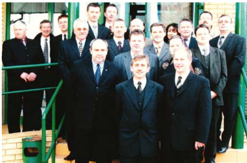
Uroczyste otwarcie nowej Centrali Banku w 2003 roku